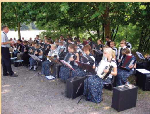
Nakkilan harmonikkojen nuoret soittamassa Ranskan Nuits de Nacre -festivaaleilla.

Lisätietoa Karhuseudun toimistolta ja www.karhuseutu.fi sivuilta!