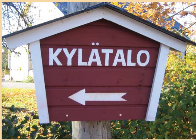
Yhteisien kokoontumistilojen esimerkiksi kylätalon, uimarannan tai leikkikentän rakentamista tuetaan Leaderillä.