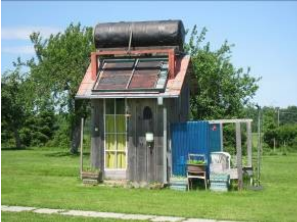
Kuva yksittäisen maaseudun asukkaan kotipihalta. Paikallinen pelle peloton oli keksinyt aurinkolämmitteisen suihkun.

Kylässä nimeltään Biliunai on museo, jonka omistaa paikallinen yksityishenkilö. Hän on kerännyt pihalleen monenlaista museoesinettä liittyen lähinnä maatalouteen ja käsityöläisyyteen. Projektin tarkoituksena on rakentaa kaksi rakennusta. Toinen rakennuksia varten ja toinen kädentaitajien työpajaksi. Esimerkiksi sepän työtä voi seurata alusta loppuun sekä myös on tarkoitus järjestää kurssuja mm. koululaisille, kunnille ja turisteille jne.