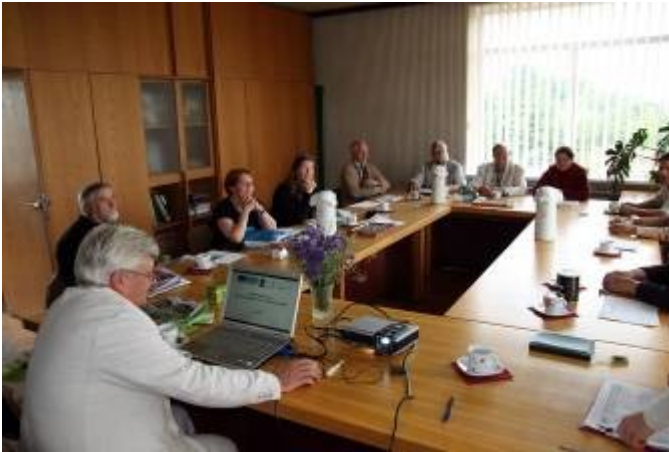
Toimintaryhmätön esittelyä puolin ja toisin

Kaupunkiläheisyyden lisäksi toinenkin asia on yhteistä Karhuseudun kanssa. Nimittäin aluetta halkoo joki Nemunas.