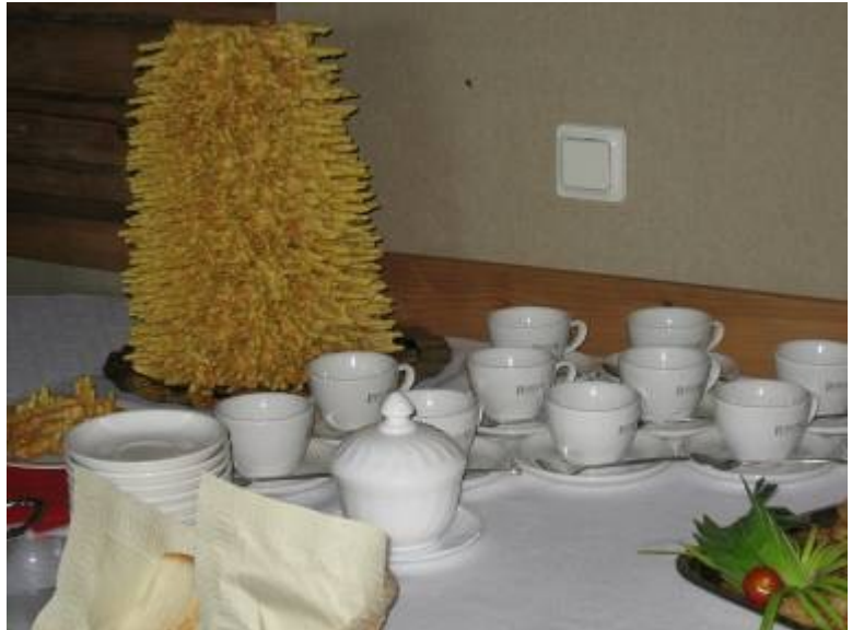
Liettuan perinnekakku, minkä tekemiseen on käytetty 50 kananmunaa