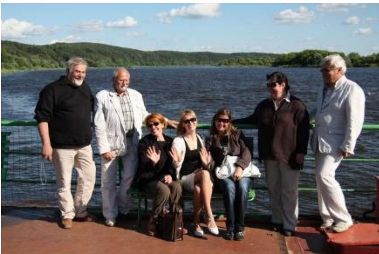
Alueillemme yhteisinä piireinä voidaan pitää jokia. Joen ylitys lossilla.