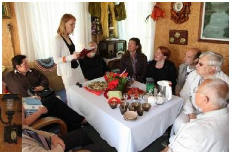
Kuvia samaisesta kotimuseosta, jonne suunnitellaan käsityömuseo keskusta. Neuvottelut seppäyhteistyöstä.