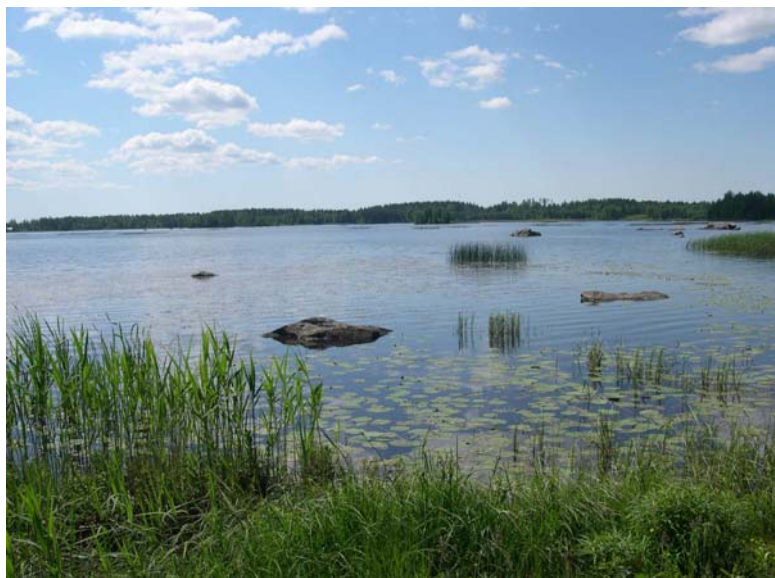
Näkymä Palusjärven rannalta

Järventaustassa on arvioitu olevan kesämökkejä ja vapaa-ajan asuntoja noin 100. Kesämökkejä sijaitsee mm. Tuurujärven, Kourijärven, Veikkojärven, Palusjärven ja Lankkojärven rannoilla.