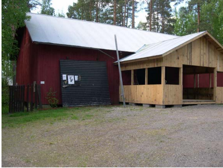
Järventaustan PVY:n suuli

Järventaustan kylässä toimii aktiivinen ja vireä Pienviljelijäyhdistys, joka on perustettu jo vuonna 1933. Yhdistys on koko toiminta-aikansa järjestänyt kylässä yhteisiä tilaisuuksia ja tapahtumia; kesäjuhlia, tansseja, talvitapahtumia sekä virkistysmatkoja. Yhdistys on rakentanut talkootyönä mittavia hankkeita oma tanssisuuli sekä Kourijärven uimarannan pukusuojat, WC, grillikatos ja uimalaituri. Pienviljelijäyhdistys huolehtii myös jääkiekkokaukalon talviaikaisesta kunnossapidosta.