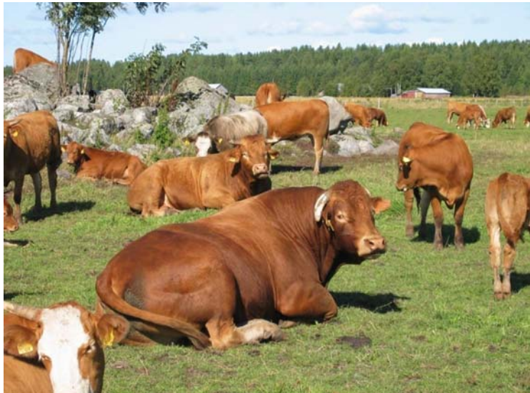
Tenhon tilan sonnit laiduntavat kylämaisemaa

Tilalla on oma teurastamo, jonka yhteydessä on myymälä. Myymälä on avoinna parittomina viikkoina lauantaisin klo 9-14 ja sunnuntaisin klo 11-14. Tilalla on myös myytävänä lampaantaljoja. Tenhon tilalla on myös omat nettisivut osoitteessa www.tenhontila.net . Eläimiä hoidetaan luonnonläheisesti. Ne ovat talvella vapaana pihatossa ja kesät laitumella. Niiden ruokintaan käytetään tilalla tuotettua rehua. Emolehmät ovat pääasiassa hereford- ja limousine -rotuisia ja karjan sonnit Dalager Pomerol ja Mäenpään Silo.