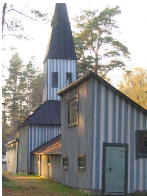
Maahengen temppeli on rakennettu 1916