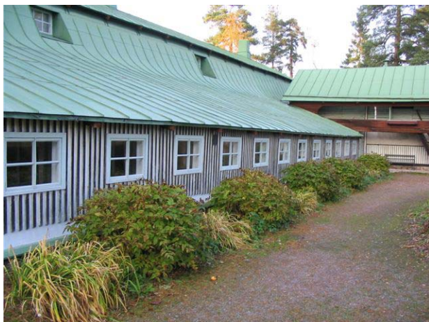
Taitelijakoti Harjula on rakennettu 1914

Paroni Emil Cedercreutz osti tontin Kokemäenjoen rannalta, suunnitteli ja rakennutti sille taitelijakoti Harjulan 1914 ja Maahengen temppelin 1916. Paroni näkyi usein kylän raitilla, etenkin kesäisin. Nykyisin Emil Cedercreutzin museo on valtakunnallisesti tunnettu museo ja kulttuurikeskus. Museon omistaa Emil Cedercreutzin säätiö ja sitä ylläpitää Harjavallan kaupunki. Tukiyhteisönä toimii kotiseutuyhdistys Harjulan Kilta ry. Yhteistyökumppaneina ovat Satakunnan Historiallinen Seura ry sekä Suomen Siluettitaiteilijat ry, joiden kotipaikka on Emil Cedercreutzin museo