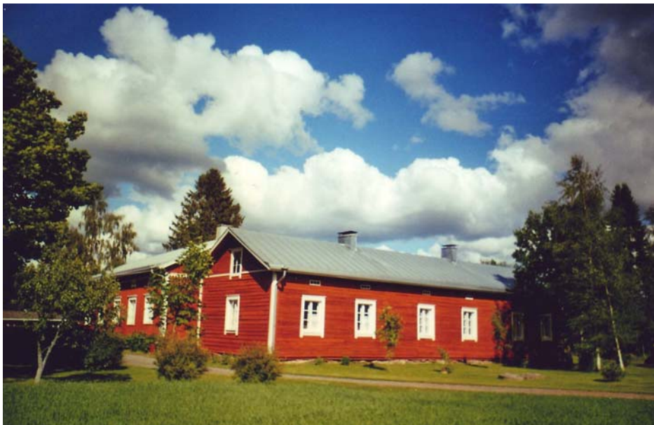
Kuva 1. Nykyiset Puontin rakennukset ovat jääneet merkeiksi tiiviistä kylärakenteesta.

Ruskilan talonpoikainen kylämaisema on perinteinen satakuntalainen kylänraitti. Aluetta halkoo valtatie 2, rautatie, Kokemäenjoki ja jo keskiajalla muodostunut paikallistie, niin sanottu vanhatie Nakkilan keskustasta kohti Poria. Kaikki nämä väylät ovat vajaan kilometrin päässä toisistaan. Poikittaisliikenteen hoitaa Ruskilan taajamasta Tervasmäen kautta Järvikylään johtava tie sekä uusi valtatie 2:n alittava tieosuus Viikinkulmalla. Alueen läpi virtaavasta vilkkaasta liikenteestä huolimatta kylämaisema on rauhallinen ja miellyttävä asuinympäristö. Pellot, metsät ja joki pienine sivujokineen, ojareineen, ovat kaunista katseltavaa sekä kesällä että talvella. Tasaisen keskellä on myös muutamia korkeampia kohtia. Korkein on Säkkinmäki, mutta keskeisin Hyppingin mäki, jonka ympäristö mielletään kylän keskuksiksi.