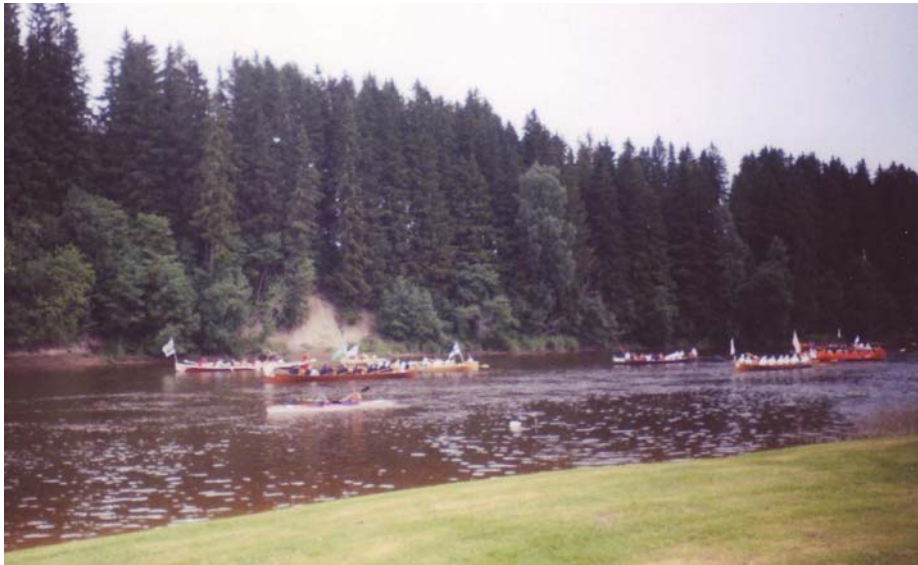
Kuva 2. Jokakesäinen jokisoutu Ruskilan kohdalla.