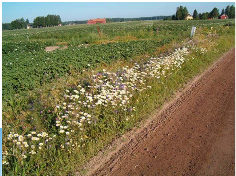
Kuva 4 Kylän peltoaukeiden maisemia.

Koska Tuomaalassa on paljon maalaismaisemaa, sen esille tuominen nähdään tärkeäksi. Kylää tulee entistää vuoteen 2013 mennessä korjaamalla huonokuntoisia rakennuksia. Tällä tavoin myös maisemaa saadaan viihtyisämmäksi. Vanhaa maalaismaisemaa ovat kuvanneet maitopukit, jotka ovat lähes täysin kadonneet tienvierustoilta. Tuomaalaan rakennetaan koristamaan ympäristöä muutama maitopukki. Maisemaa rumentavien, vanhojen, lahoamispisteissä olevien suulien korjaamista pidetään tärkeänä viihtyisyyden edistäjänä. Kylän viihtyisyyttä edistää myös pihapiirien siisteys ja kauniit istutukset.