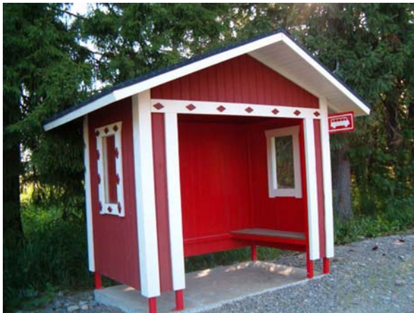
Kuva 2 kyläyhdistyksen talkoilla on rakennettu koulun pihapiiriin mm. bussipysäkki koululaisille ja grillikota.