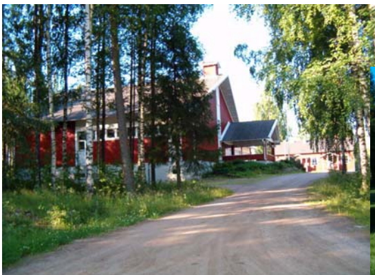
Kuva 3 Kylän koulualueen maisemia.